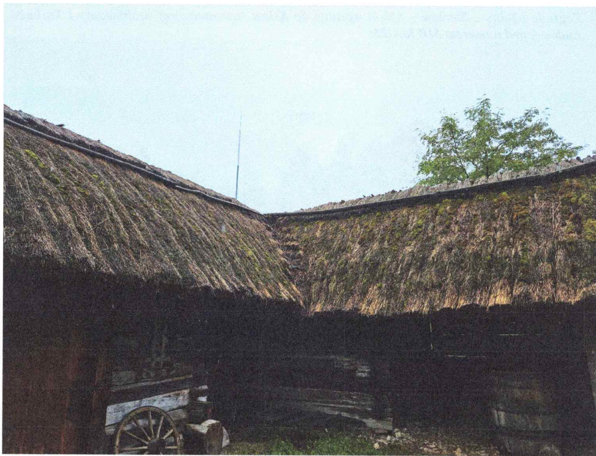
5. Obora z Brzezin (w Zagrodzie z Bielin) – obiekt wpisany do Księgi Inwentarzowej Architektury i Techniki Ludowej pod numerem MWK/A/42;