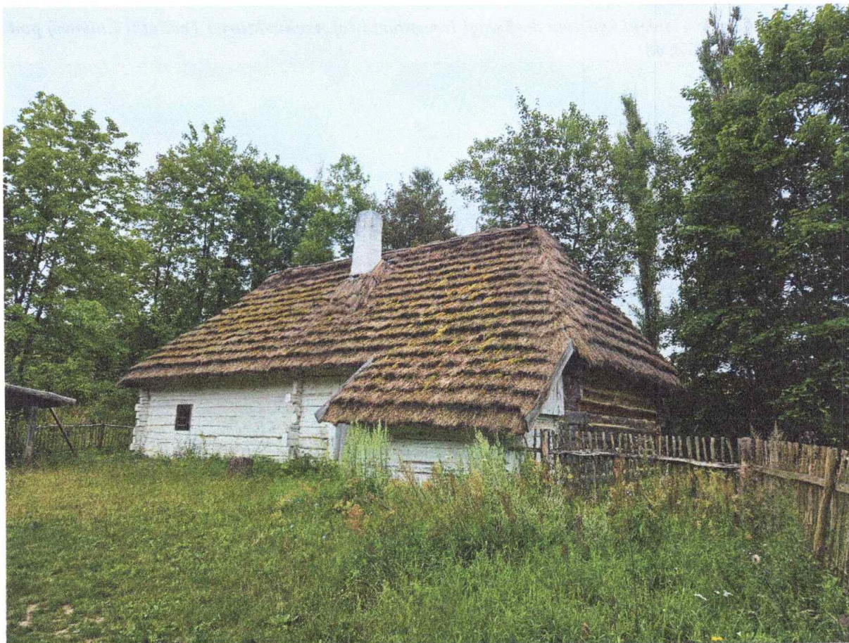
3. Chalupa z Nasiechowiec – obiekt wpisany do Księgi Inwentarzowej Architektury i Techniki Ludowej pod numerem MWK/A/52;